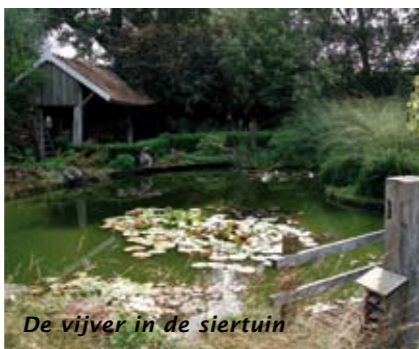
De vijver in de siertuin

Het mag duidelijk zijn: de Schepershof is een mooie werkplek en biedt het hele jaar rond prettige werkzaamhe-